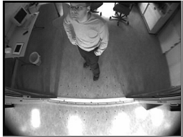
Bild tagen av sensorn vid närvarodetektion. Sensorn är vinklad så att den ser in genom dörröppningen. Den andra kameran är monterad på andra sidan, och det överlappande området utgör zonen för närvarodetektionen.

WeSpot har idag ca 20 anställda, har två kommersiella produkter och en som är under fälttest där alla förväntas ha en stor marknadspotential.