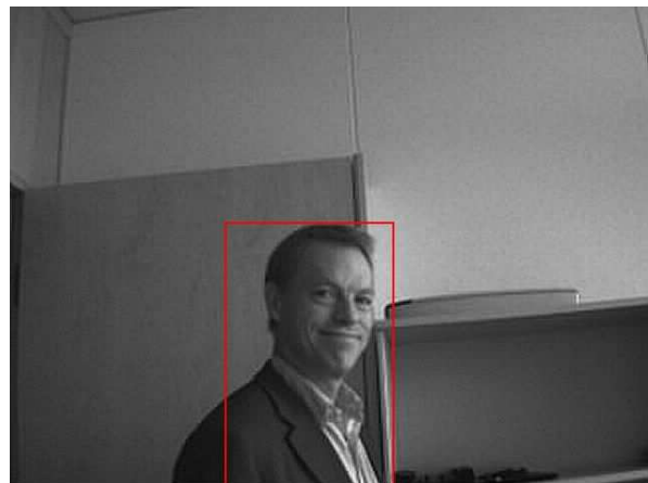
Bild tagen av den GPRS baserade inbrotts-sensorn, där en inkräktare detekterats. Bildanalysen upptäcker rörelsen, väljer ut de 1-3 bästa bilderna och markerar rörelsen i bilderna. Dessa JPEG-komprimeras och skickas till en angiven e-post adress via GPRS.

Lennart Christensson, CTO (lennart@wespot.com) Stefan Esping, bildanalysansvarig (stefan@wespot.com) WeSpot AB