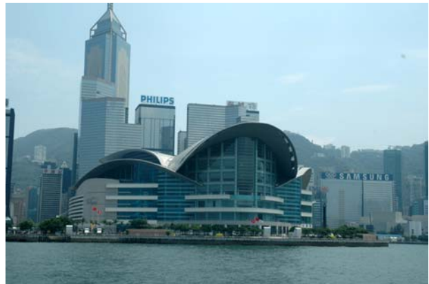
Hong Kongs magnifika konferenscenter.