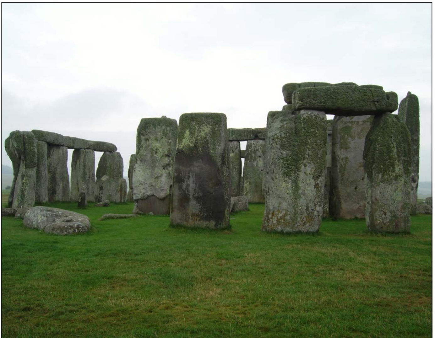
Irreguljärt samplade ickekubiska voxlar i en ring.

MEMBER OF THE INTERNATIONAL ASSOCIATION FOR PATTERN RECOGNITION